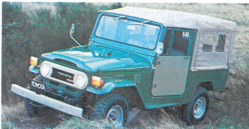
Land Cruiser Vinyl Top (bâché)