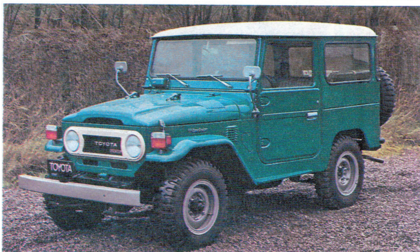
Land Cruiser Hard Top (tôle)