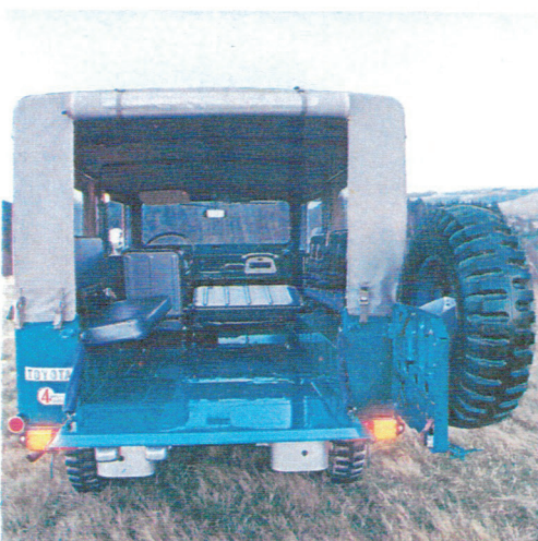
Land Cruiser Vinyl Top (bâché)