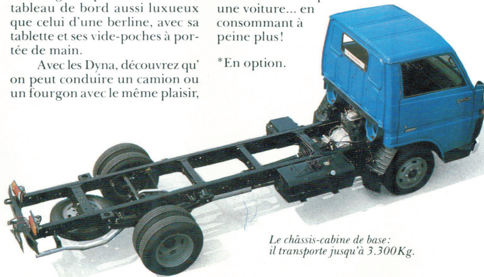
Le châssis-cabine de base: il transporte jusqu'à 3.300Kg.