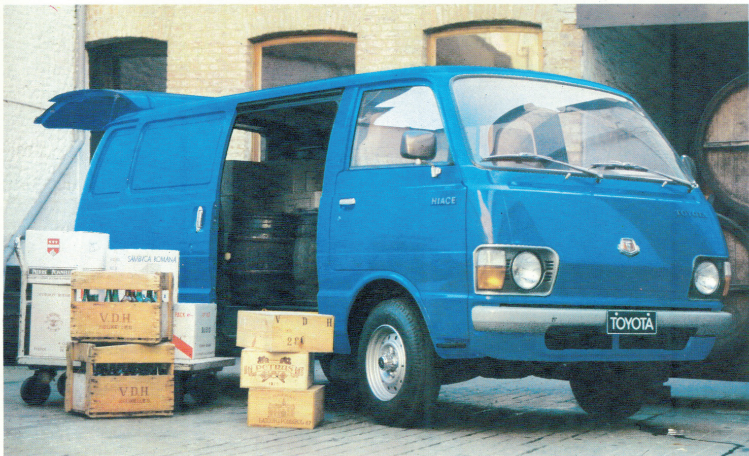
Le Hi-Ace: un fourgon tôlé, super-robuste et pratique.