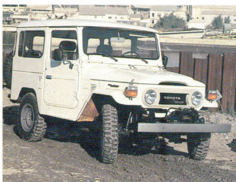
Le Landcruiser châssis court: déjà un succès en Belgique.

Au point mort, la boîte de transfert permet d'utiliser la puissance du moteur pour actionner un treuil livré en option.