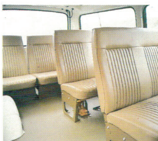
La version minibus: des sièges confortables pour 9 personnes!

Version diesel, c'est un champion vitesse-économie: son moteur diesel passe en effet de l'arrêt à 100 km/h en 55 secondes seulement. Pourtant, il ne consomme que 9,5L/100. Pour obtenir cette performance, Toyota n'a pas lésiné sur les moyens: les 4 cylindres 2,2l développent 66 CV DIN (48 KW). Un arbre à cames en tête entraîné par une courroie crantée explique la vivacité de ce diesel peu ordinaire. Et si vous préférez la version moteur à essence, vous ne serez pas déçu: même perfor-