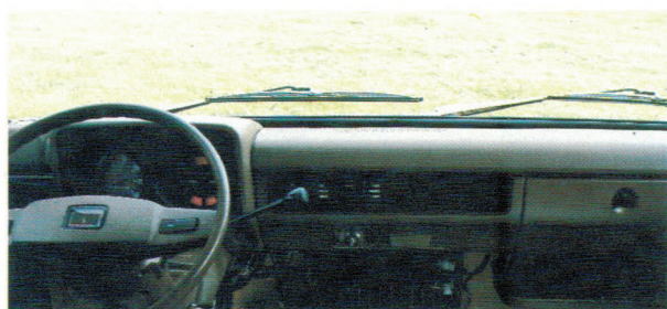
Un tableau de bord luxueux et bien étudié.

mances et un entretien minimum: vidange tous les 5000km, entretien moteur tous les 20000, grand entretien tous les 40000km.