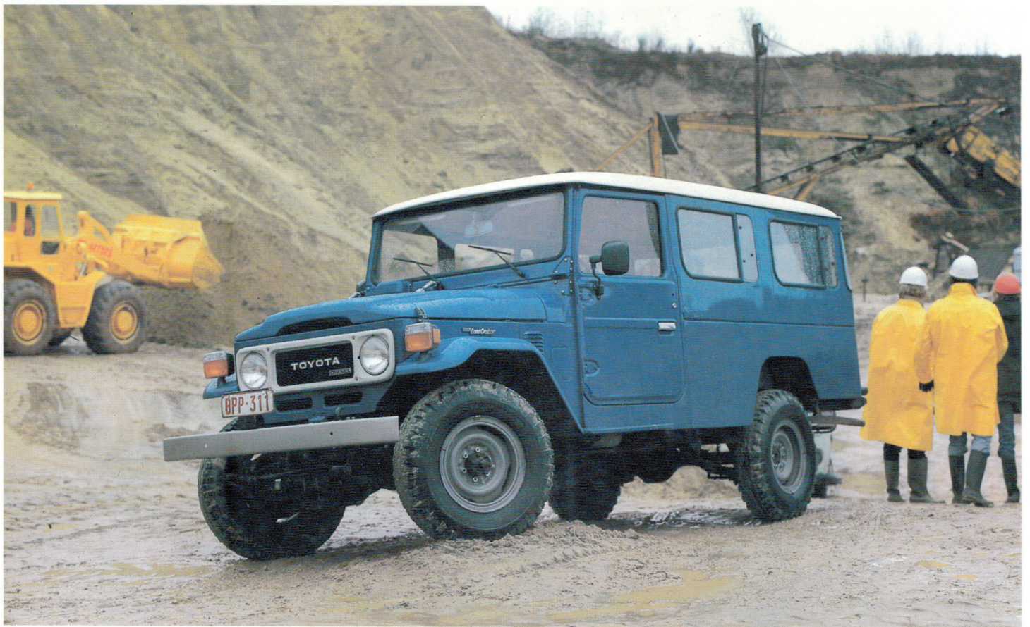
Le long châssis hardtop, idéal pour transporter du matériel sur le chantier ou être converti en "sleeping car" de grand safari.