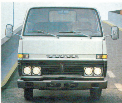
Le Dyna peut être livré sur mesures avec plateau, benne ou carrosserie.