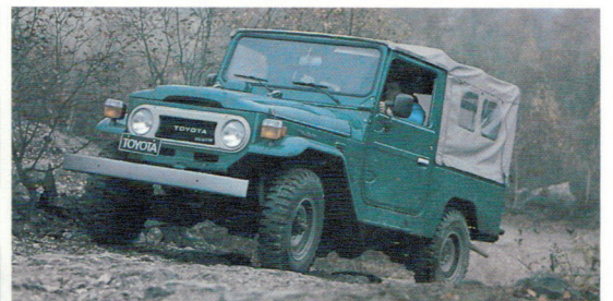
Le Landcruiser châssis semi-long, toit vinyl: tous boulots - tous safaris, dont la bâche s'enroule et s'enlève aisément.