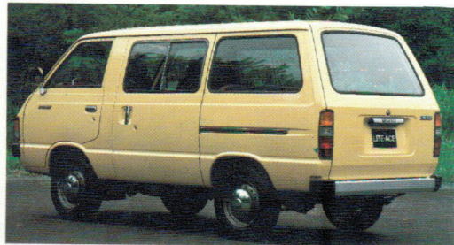
2 versions 5 portes, et un station wagon, à 4 portes à pavillon surélevé: il y a un modèle Lite Ace pour vous.

excellente tenue de route, des freins servo assistés permettant des arrêts précis et en ligne et un champ de vision panoramique à l'avant.