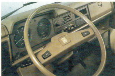
Un tableau de bord comme peu de "Gros Bras" en ont!

La finition et l'équipement intérieur du Toyota Dyna ont une qualité presque exceptionnelle dans ce type de véhicule.