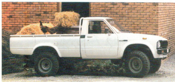
Un profil élégant, de la place pour transporter matériel et marchandises.

V ous avez envie d'un tous- transports qui vous donne en même temps cette sensation sportive d'un tous-terrains: