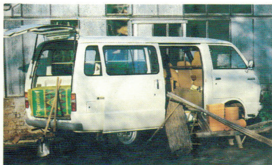
Le modèle vitré à portes latérales pour un chargement facile. Existe aussi en châssis-cabine et pick-up.

long en camionnette, pick-ups et châssis-cabines.