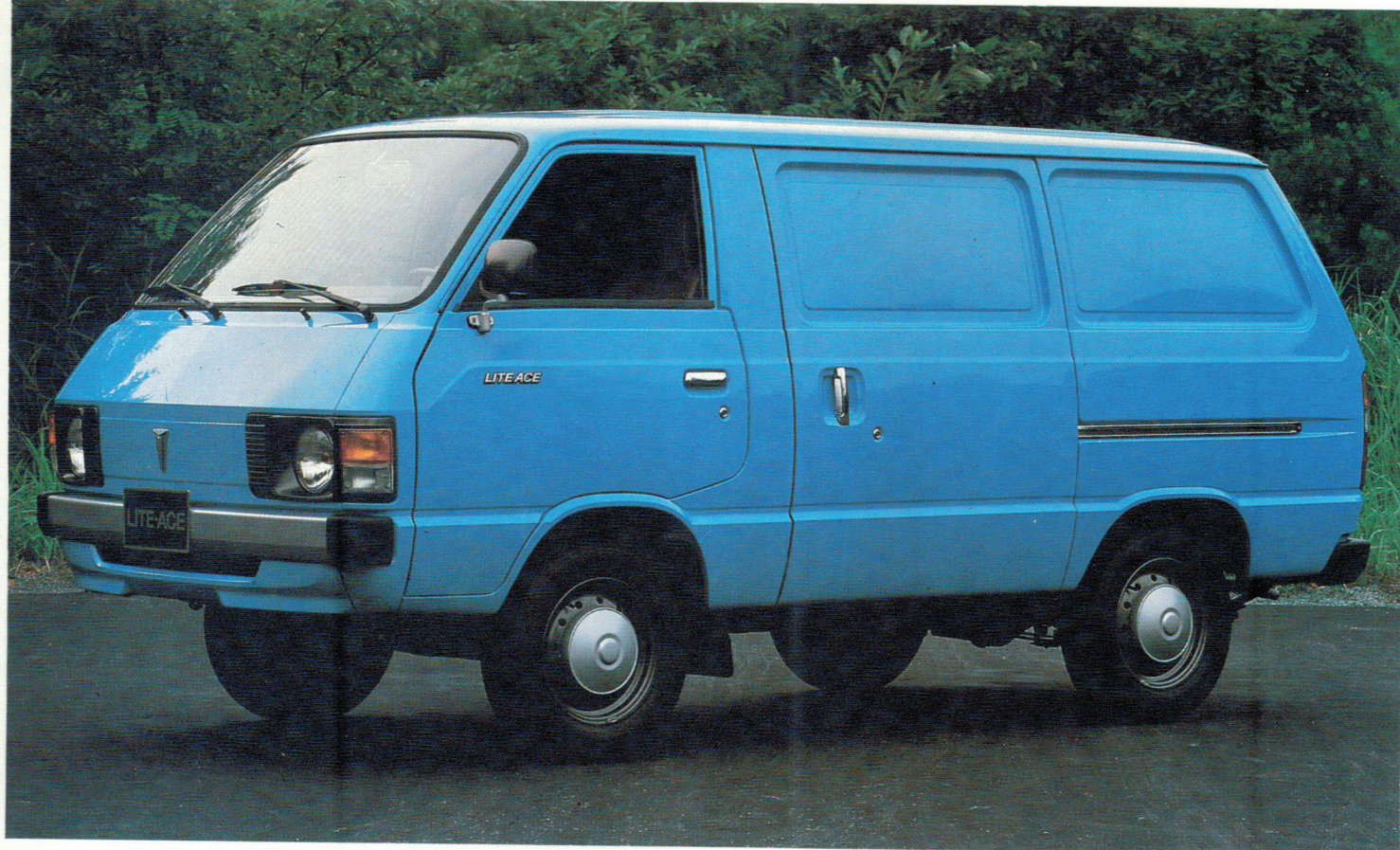
Pratique et élégant, le Lite Ace à portes latérales coulissantes.