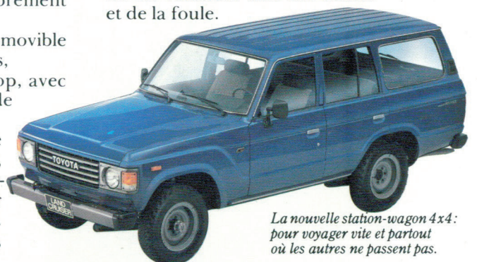
La nouvelle station-wagon 4x4: pour voyager vite et partout où les autres ne passent pas.

Une nouvelle façon de rouler en voiture... loin des routes et de la foule.